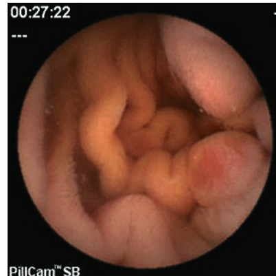
PillCam ™ SB カプセル内視鏡が撮影した小腸内部

例えば、便に血液が混じっていた場合、大部分は上部消化管(食道、胃、十二指腸)か大腸に原因があり、胃カメラか大腸内視鏡検査で原因が判明します。肛門から出血があったのに胃や大腸の内視鏡検査等をしても病変がない場合などがカプセル内視鏡検査の対象になります。出血以外にも小腸炎症疾患や小腸腫瘍、寄生虫などが強く疑われる場合はカプセル内視鏡検査の対象となることがあります。